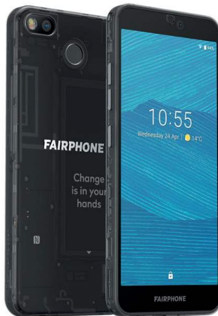
Figura 8: Fairphone 3