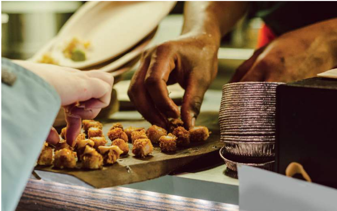
Figura 9: Muestra gratuita de un nuevo producto