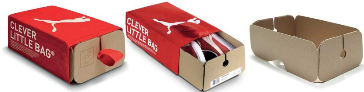
Figura 11: Ejemplo de la bolsa reutilizable Clever Little Bag de Puma