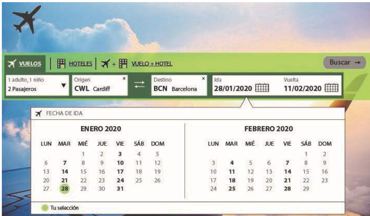
Figura 7: Sitio web de reservas de vuelos