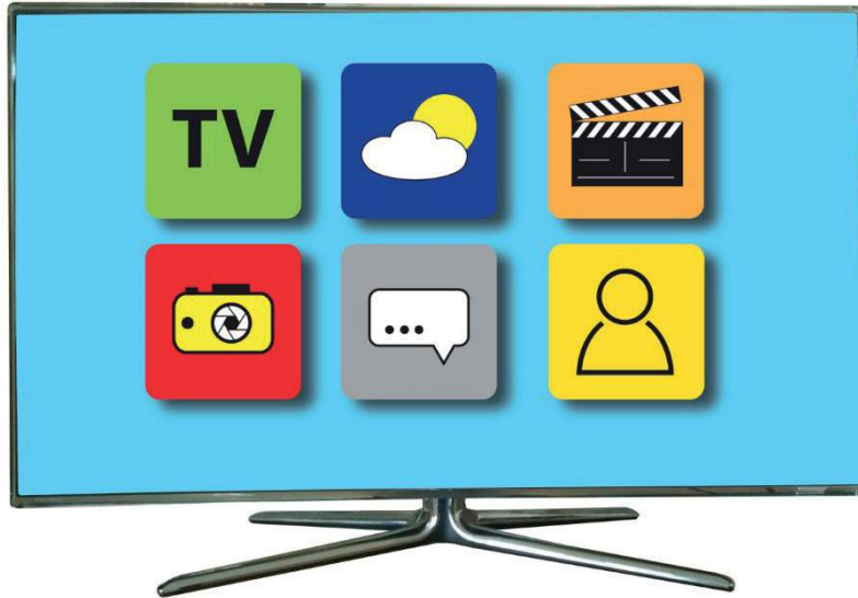
Figura 2: Televisión compatible con Internet

¿Cuál es un ejemplo de televisión compatible con Internet?