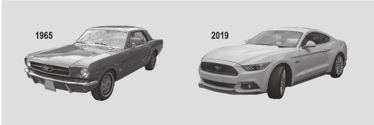
Figura 6: Ford Mustang