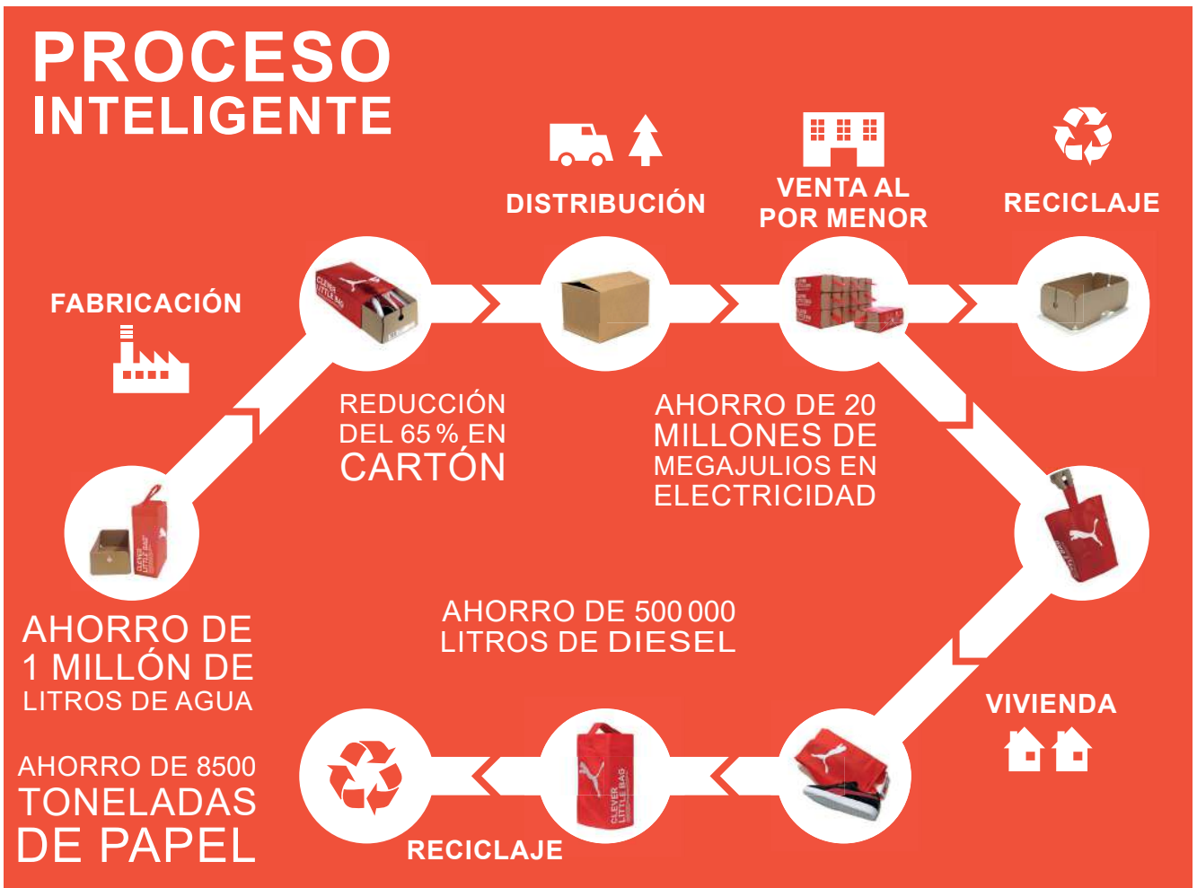
Figura 12: Gráfico del proceso de fabricación de las bolsas reutilizables Clever Little Bags