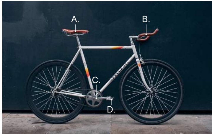
Figura 1: Bicicleta