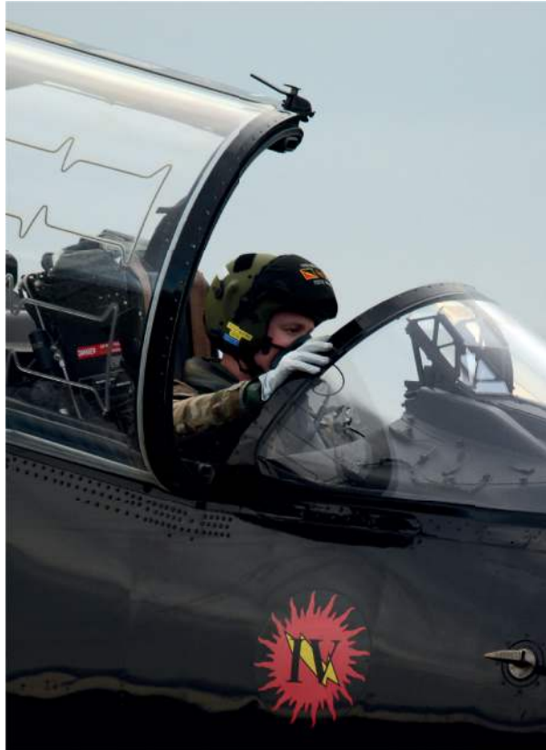
Figura 4: Cubierta de cabina de un avión