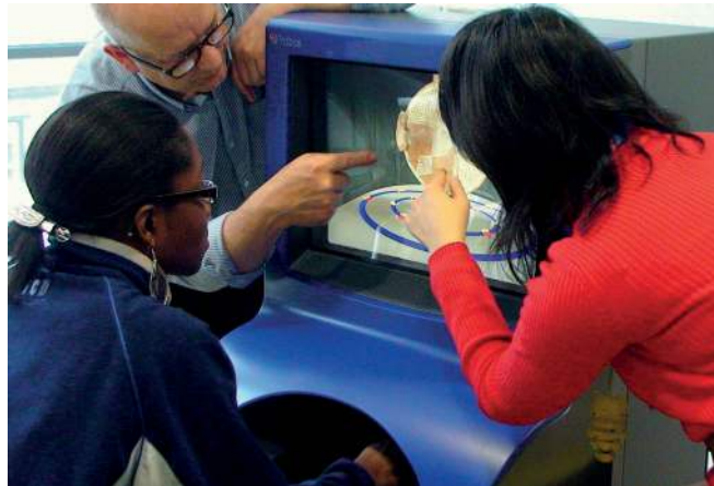
Figura 3: Gente interactuando en una exhibición en el museo